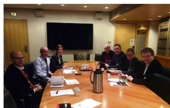
Blatt TILS er kommunerådet som er engasjert i et samarbeid mellom kommunene. Fra til høyre: ordfører i Nord-Fron, Sør-Fron og Ringebu kommuner.

Det er viktig å ha et navn som er kjent og som gir et godt inntrykk. Gudbrandsdal er et navn som har vært brukt i mange år og som er kjent for mange.